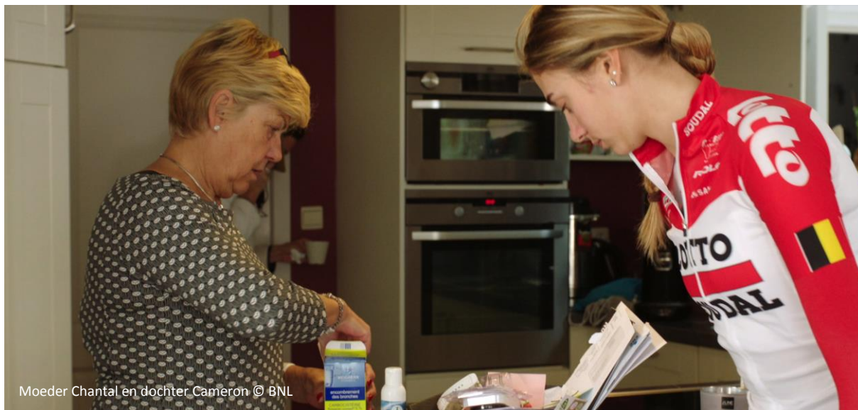
Moeder Chantal en dochter Cameron

“Franks dochter zijn is een godsgeschenk. Hij had heel veel zelfvertrouwen, maar hij was toch ook heel gevoelig.”